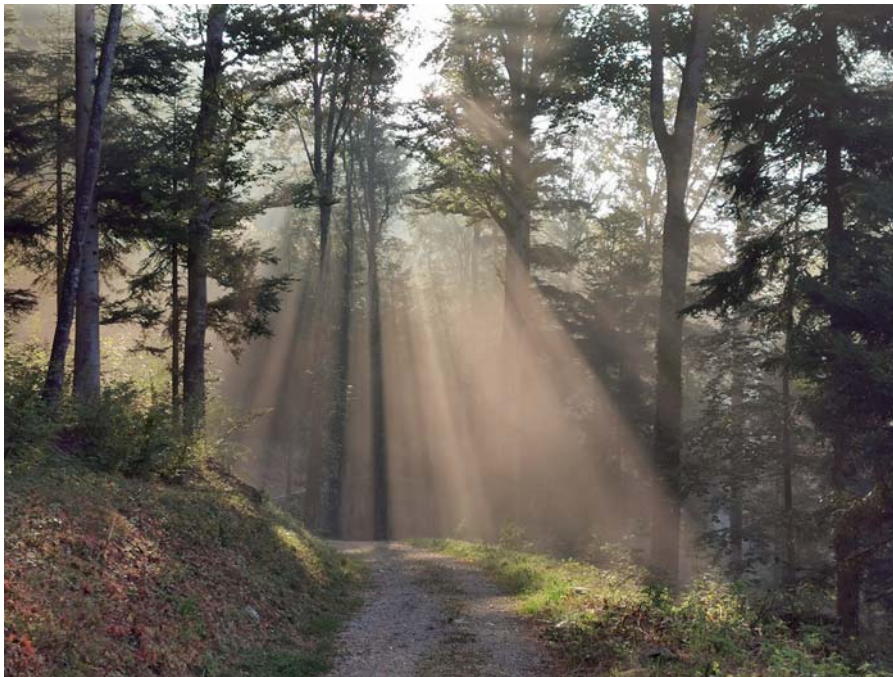
Auf dem Wanderweg um den Schaufelberg