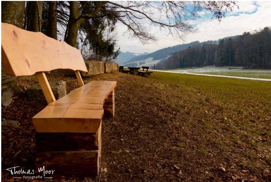
Schöne Sicht auf schöner Bank. Danke!